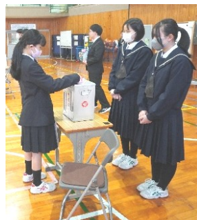
一中の未来を語り、未来を選ぶ生徒会選挙