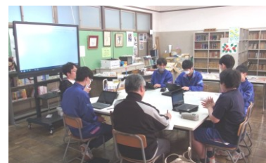
「学校づくりを考える会」の様子

11月6日(木) 再来年度の中学校統合をひかえ、二中と合同で行った「学校づくりを考える会」では、「こんな学校を作りたい」という様々な「願い」や「思い」が出されました。その後、出された意見から議論が深まりそうな25の内容をあげ、一中・二中の全校生徒と職員を対象にアンケートを行いました。