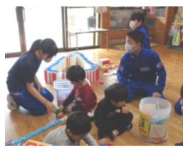
大下条保育園で保育実習