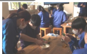
若い技術者たちから学ぶ

今年も興亜エレクトロニクス(株)の技術者をお招きし、2年生が技術科の授業のなかで「メロディーこま」を作りました。「阿南町に貢献したい!」という企業としての願いか