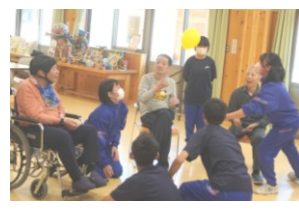
阿南学園での交流学习

ら毎年実施していただいている出前授業です。3年生は今年も大下条保育園で保育実習をさせていただきました。また、今年度は、コロナ後久々に阿南学園やデイサービスセンター「サルビア」の皆さんとの交流の機会も復活しました。地域のなかで世代をこえた交流ができている環境に感謝です。