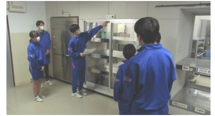
…現場で自分の仕事分担を確認

□今日は新しい生徒会がありました。私は委員長になったので本当に緊張しました。思った以上に当番表の確認や修正に時間がかかりました。次はもう少しスムーズに進められるように計画したいです。(生徒の生活記録から)