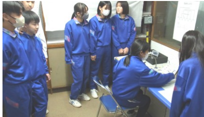
…2年生がリーダーとなり進行