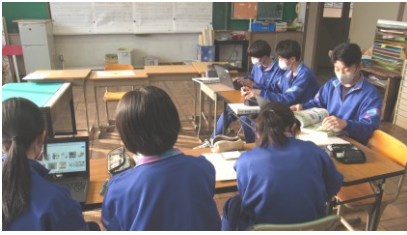
…さっそく動き出した生徒会総務

生徒会は3年生から2年生へとバトンタッチされました。来年度を見据え、新たな気持ちで活動に励んでいます。