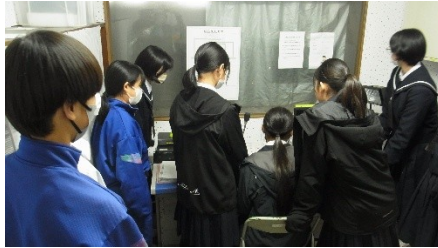
…各委員会で当番活動を確認