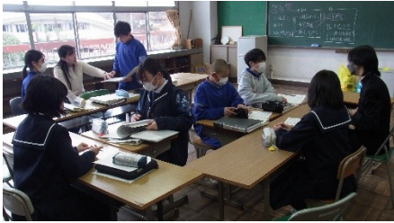
…新日生徒会総務で仕事を引継ぎ

1月となり、生徒会が3年生から2年生へとバトンタッチされ、フレッシュな気持ちで活動に励んでいます。その一方、本校の購買室は昨年12/23(月)をもって長い歴史に幕を閉じました。ひとつの歴史が終わりました。