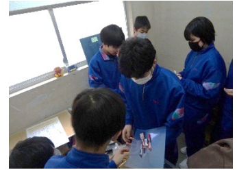
…満員御礼！購買・最後の営業日

□ 今日、初めての生徒会がありました。自分たちで意見を出しあって決めるのはなかなか大変でした。「やっぱり3年生はすごいなー」と思いました。