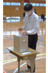
一中の未来を語り、未来を選ぶ生徒会選挙