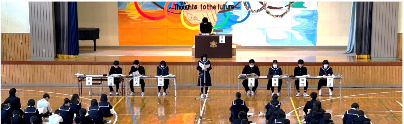
1年間を総括する今年度最後の生徒総会

今日は3年生にとってはラストの生徒総会でした。最初でちょっとミスがありましたが、あの方々はスムーズに進めることが出来ました。時間が少しオーバーしてやりきれなかった部分もありましたが、臨機応変に行動できました。1年間を通して、自分でも、以前よりも成長できたと感じました。(3年生の生活記録より)