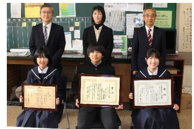
実社会とつながる「税の標語」表彰

今年も興亜エレクトロニクス(株)の技術者をお招きし、2年生が技術科の授業のなかで「メロディーこま」を作りました。「阿南町に貢献したい!」という企業としての願いから毎年実施して頂いている出前授業です。3年生は今年も大下条保育園で保育実習をさせていただきました。地域のなかで世代をこえた交流が当たり前のようにできている環境に感謝です。「地域とのつながり」は本校の特色であり、そんななかで今年も「税の標語」や「税の作文」で生徒たちは地域社会に目を向けた作品を書き、多くの入賞者を出すことができました。