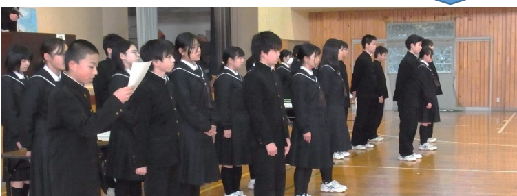
仕事と想いを引き継いだ2年生たち

今日は3年生にとってはラストの生徒総会でした。最初でちょっとミスがありましたが、あの方々はスムーズに進めることが出来ました。時間が少しオーバーしてやりきれなかった部分もありましたが、臨機応変に行動できました。1年間を通して、自分でも、以前よりも成長できたと感じました。(3年生の生活記録より)