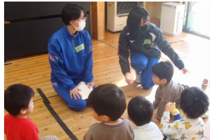
大下条保育園での保育実習