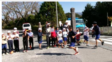
富草小の皆さん、声援ありがとう