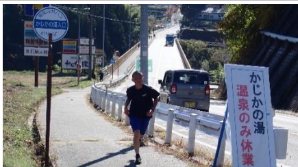
山を越え、谷を越え・・・