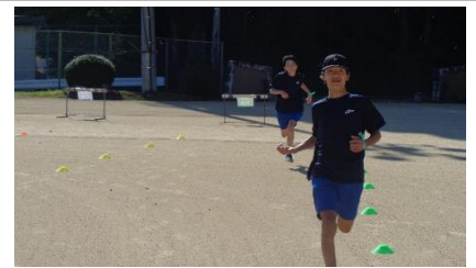
ゴール前、ラストスパート!

11月13日(水)、秋晴れのなか、今年も強歩大会が行われ、出場した全員が見事に完走を果たしました。補助員を務めてくださったPTAの皆様、応援して下さった地域の皆様、ありがとうございました。