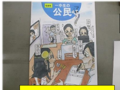
自分たちで教科書を作る(3年公民)