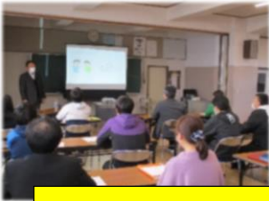
授業づくり研修会(対話的な学びの体験)

阿南町が目指す子どもたちの姿(学力・考動力を身に付けた子ども)の実現を目指し、阿南一中としての授業観を生徒、保護者の皆様、教職員で共有し、確かな生きる力を育む教育(授業)を行っていききたいと思います。何卒、ご理解とご協力をよろしくお願いいたします。