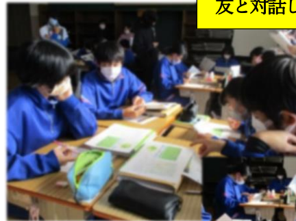
友と対話し、考えを深める