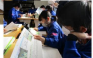
教材と対話し、問いや考えを持つ